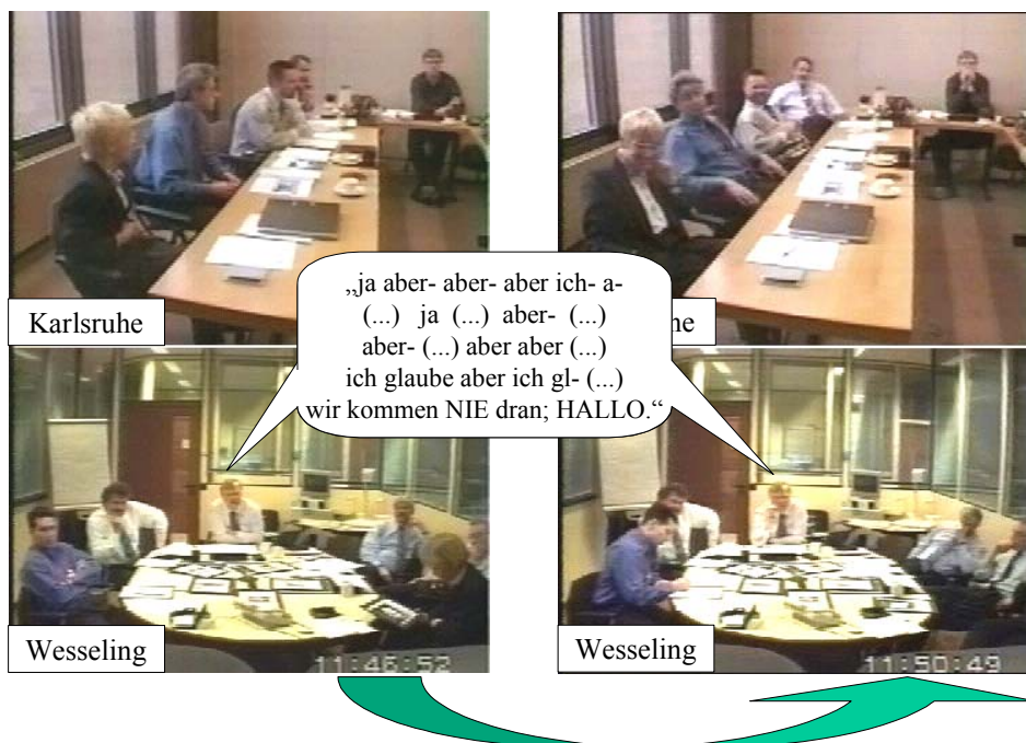
Abbildungen 1 und 2

Die Schwierigkeit, sich im Verlauf einer (kontroversen) Diskussion "hier" von "dort" aus einzubringen, zeigt sich sehr deutlich in folgender Szene: Man diskutiert gerade über einen kurz zuvor vorgestellten Entwurf für eine Werbekampagne. Während die am Standort Karlsruhe versammelten Teilnehmer kontrovers diskutieren, versucht sich ein Kollege vom Standort Wesseling aus einzubringen. Zunächst allerdings vergeblich. Im Verlauf von etwa vier Minuten unternimmt er insgesamt vier Anläufe, um sich mit einem Beitrag in die laufende Diskussion einzuklinken, bevor er schließlich massiver wird und sich laut beklagt: "wir kommen NIE dran". Erst dann findet er Gehör.